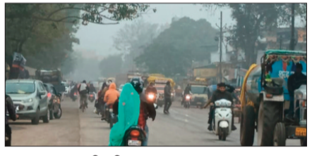
हरिभूमि न्यूज आष्टा

नगर सहित क्षेत्र में भी कोहरा देखने को मिल रहा है। गुरुवार 4 जनवरी की सुबह कोहरे के आगोश में नगर डूबा नजर आया। नगर और आसपास के ग्रामीण क्षेत्रों में भी देर रात से ही कोहरा छाने लगा था, जो सुबह तक काफी बढ़ गया। सुबह 40 मीटर की दूरी पर भी कुछ दिखाई नहीं दे रहा था। करीब 11 बजे के बाद कोहरा कुछ अंछा तो लोगों ने राहत महसूस की। लेकिन नगर से अठो ग्रामीण क्षेत्रों में मावटा गिरा विजिबिलिटी लगातार कम होती गई। दिन और रात के तापमान का अंतर भी बढ़ने लगा है। ग्रामीण इलाकों में सर्द हवाओं ने लोगों को ठिठुरने पर मजबूर कर दिया। नगर में दिन में अलाव जलाए गए। सर्द हवाओं ने बच्चों और बुढ़ों को कंपकंपा दिया। नगर में इस बार मौसम का अलग ही अंदाज देखने को मिला रहा है। दिसंबर में जहां उममीद के मुताबिक ठंड इस बार नहीं पड़ी, वहीं अब जनवरी में भी शुरुआत से ही मौसम का अलग अंदाज देखने को मिल रहा है। रात में जहां शीतलहर चलने से ठंड का अहसास हो रहा है। गुरुवार की सुबह नगर सहित ग्रामीण क्षेत्रों में