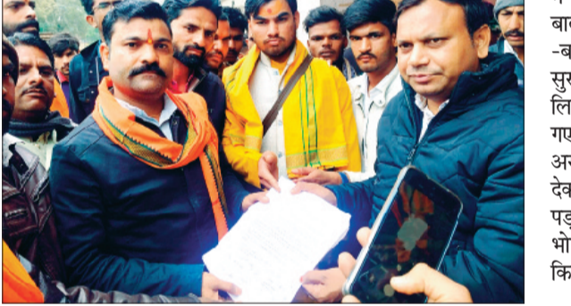
हरिभूमि न्यूज आष्टा