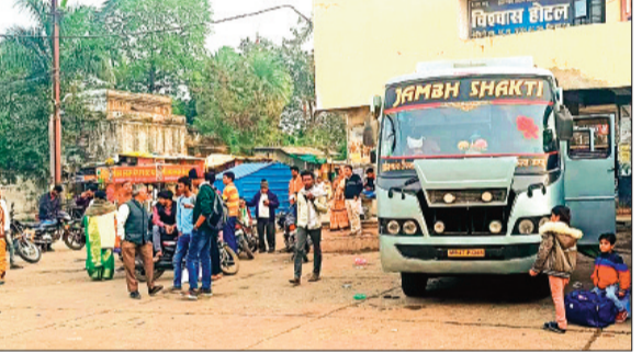
हरिभूमि न्यूज आष्टा

झाड़वों की हड़ताल के चलते बस और ट्रक सहित अन्य वाहन सड़कों पर दिखाई नहीं दे रहे थे। बीती रात्रि में हड़ताल खत्म हो गई थी इसके बाद आज सुबह से सड़कों पर ट्रक-बस एक बार फिर से दौड़ने लगे हैं। सुरक्षित परिवहन उपलब्ध कराने के लिए केंद्र सरकार की ओर से बनाए गए कानून के विरोध में यात्रियों को असुरक्षा के साथ डेढ़ गुना किराया देकर यात्रा करने को मजबूर होना पड़ा। आलम यह है कि आष्टा से भोपाल की दूरी करीब 80 किलोमीटर है।